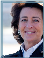
Sra. Dña. Isabel Oriol Presidenta ASOCIACIÓN ESPAÑOLA CONTRA EL CÁNCER